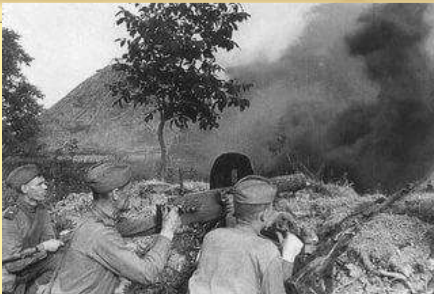
Лето 1943 г. Битва на Курской дуге