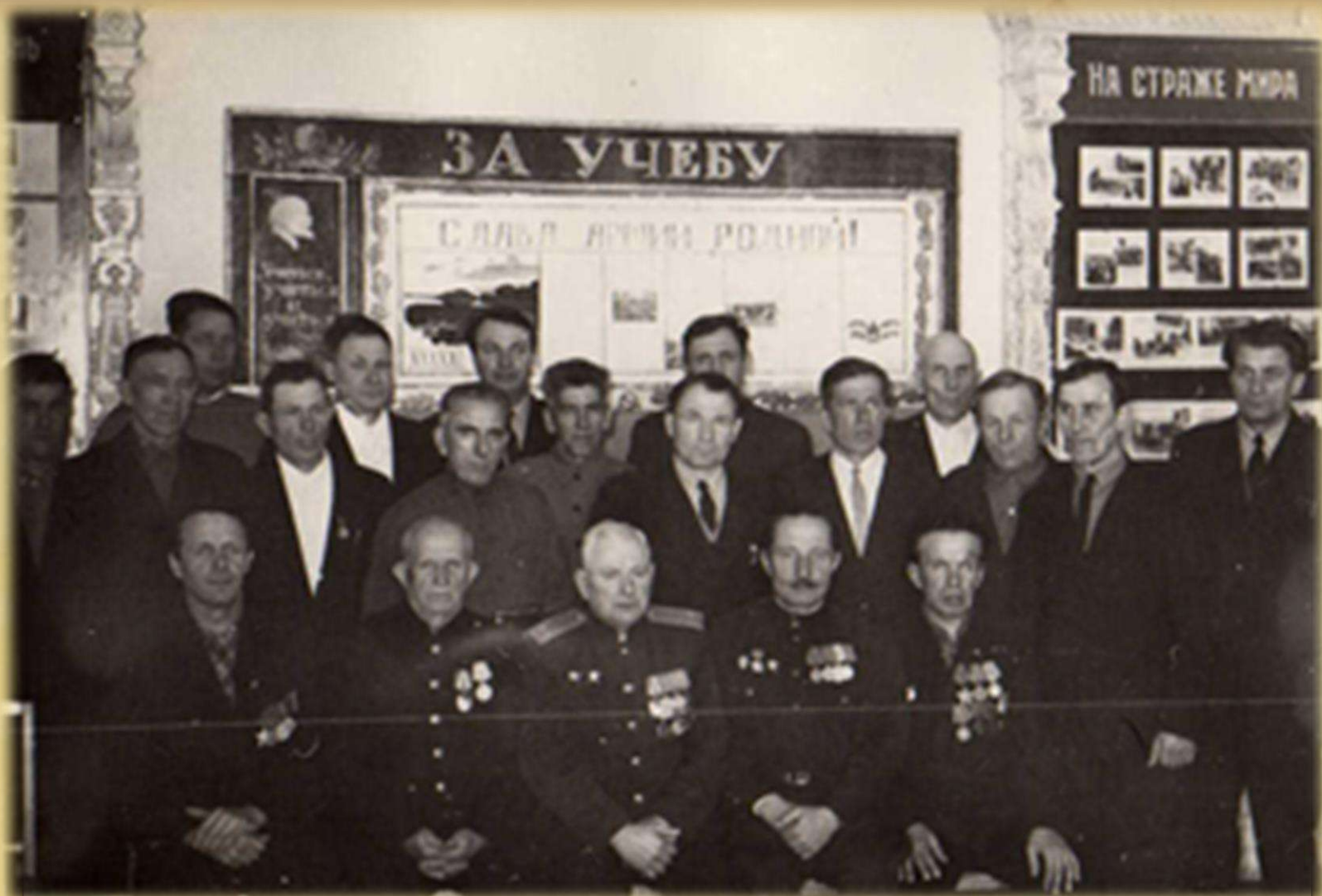
Встреча с ветеранами Великой Отечественной войны