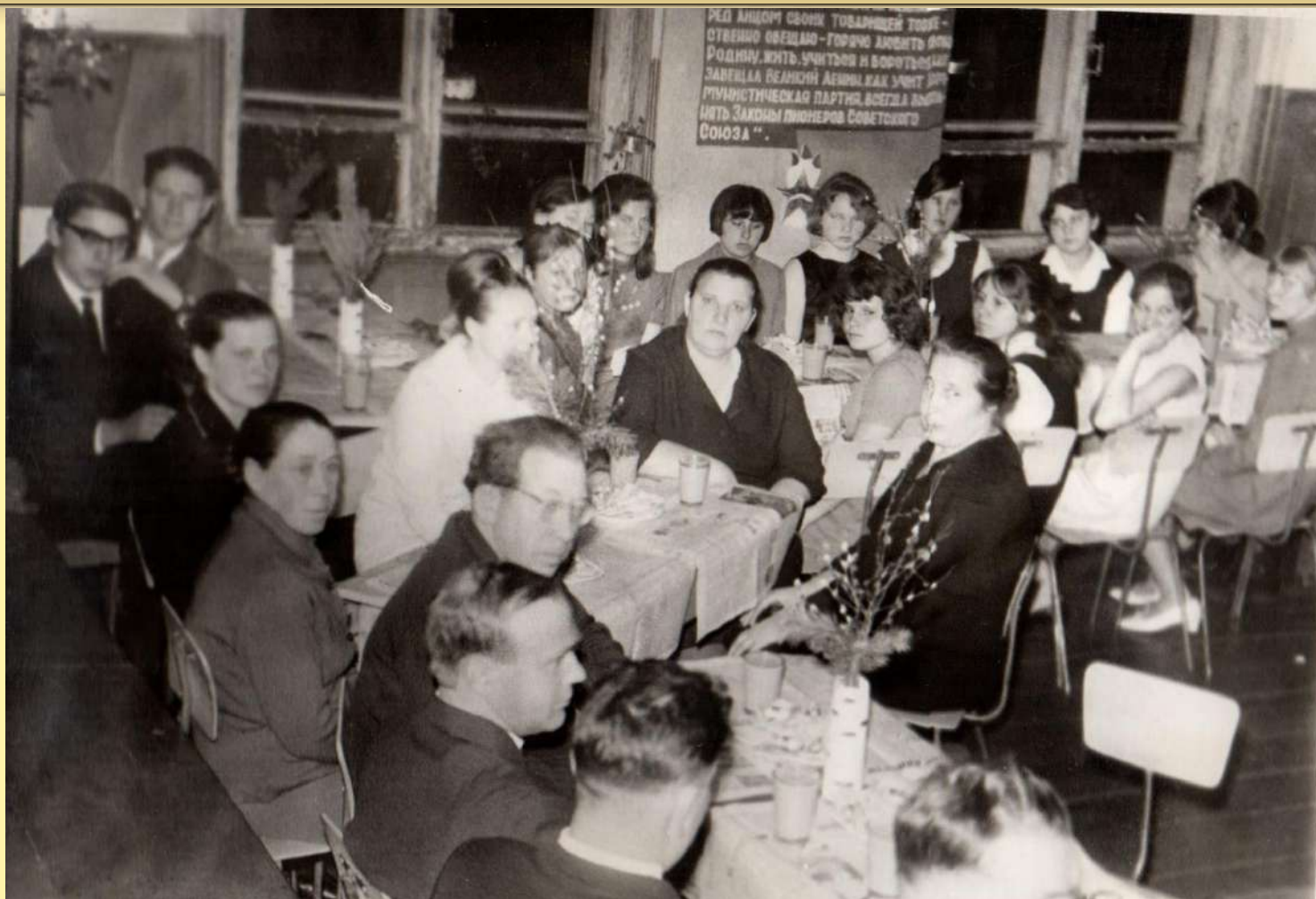
Вечер встречи учащихся выпускных классов с производителями, передовыми людьми села