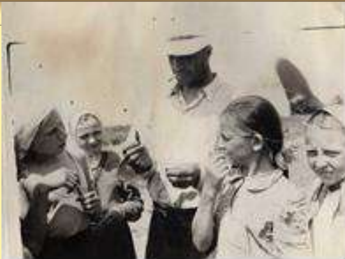
Найден наконецник стрелы