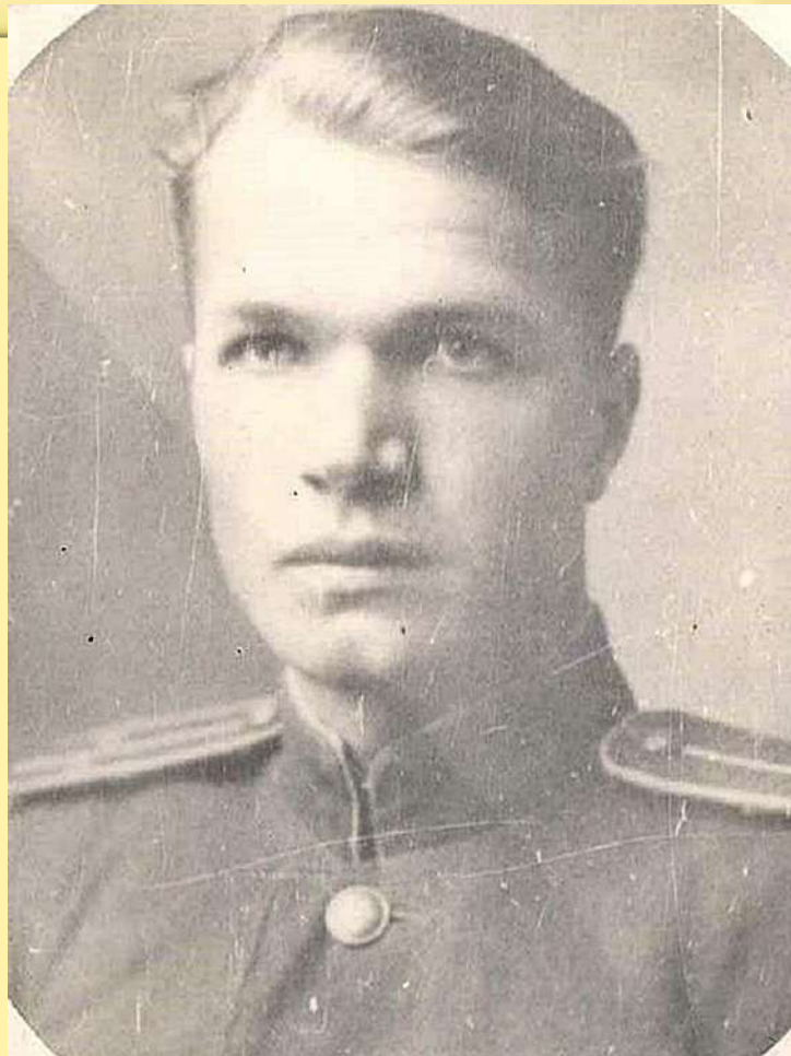
Выпускник Касимовской пехотной школы (ускоренный выпуск)