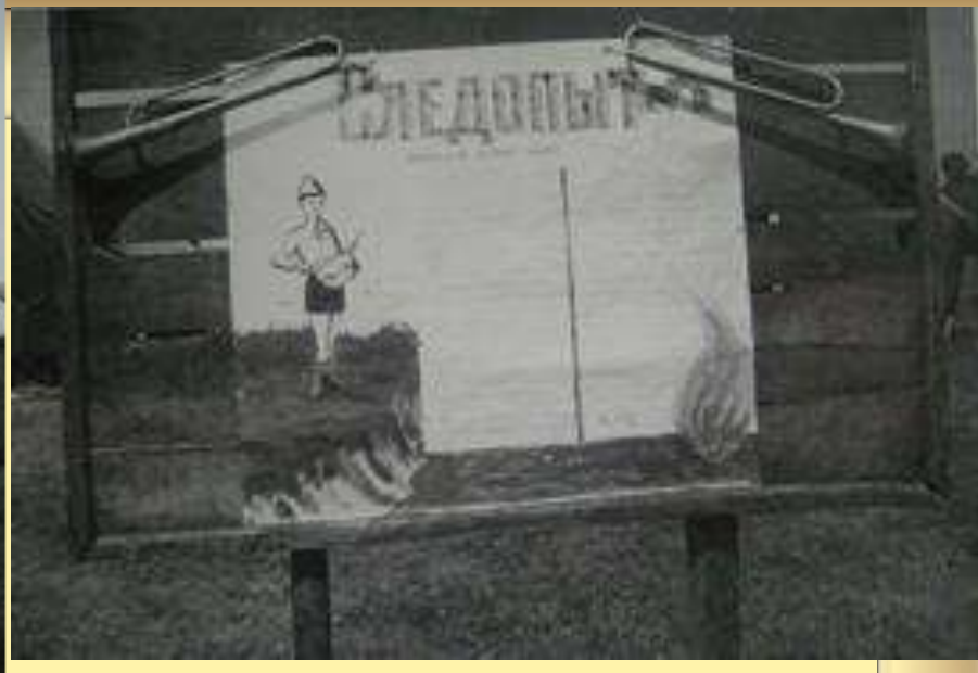
1963 г. Выездной лагерь «Следопыт»