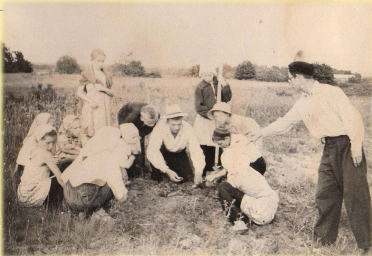
Во время раскопок на стоянке «Тынок»