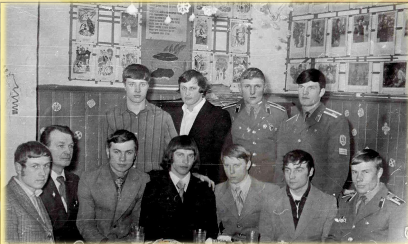
Вечер встречи с курсантами Советской Армии