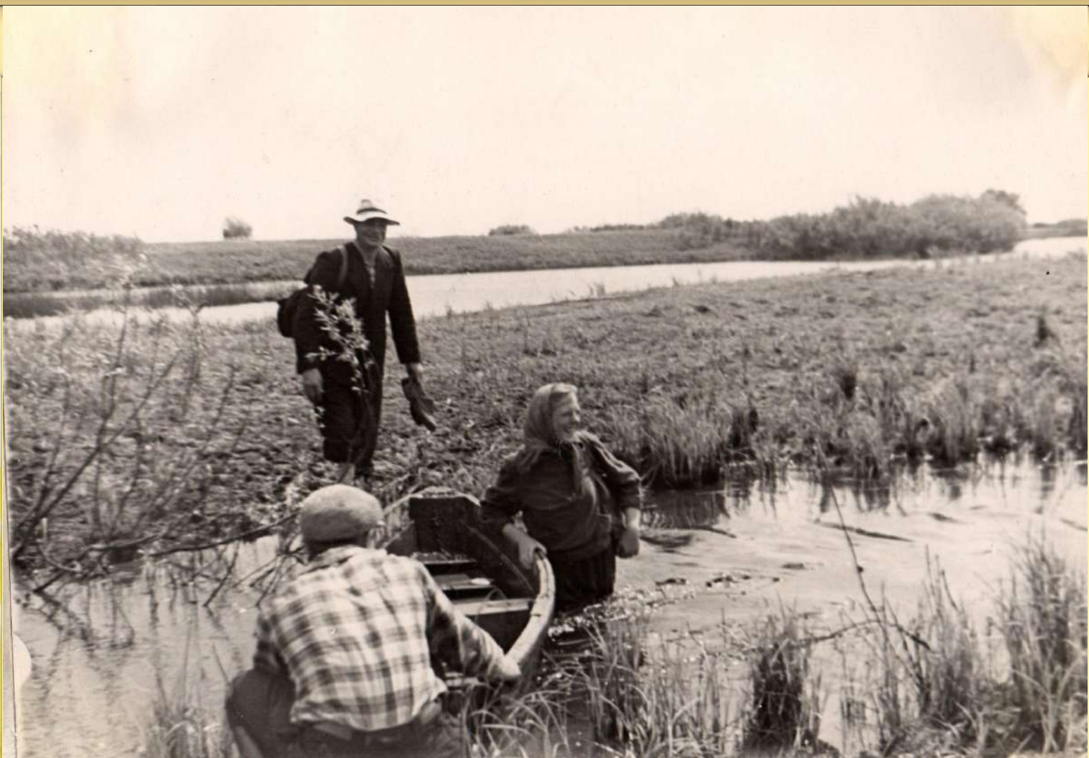
Переправа через речку