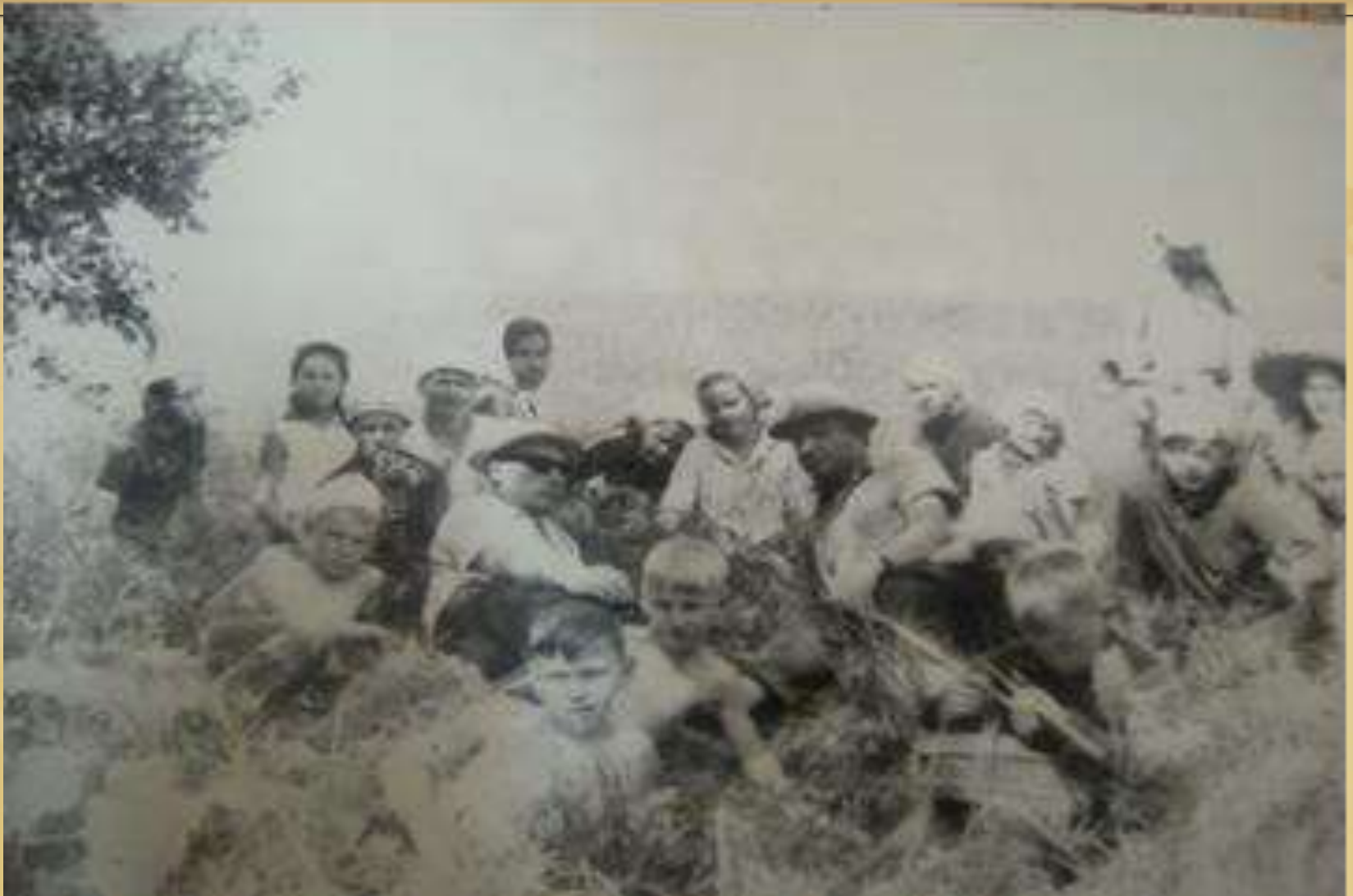
Раскопки на «Добрыне острове»