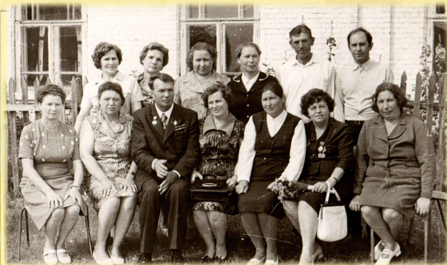
Встреча выпускников 1942 года Ерахтурской школы